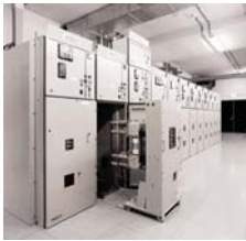
MMS 3,6–24 кВ

Модульное распределительное устройство с металлическим корпусом и двойными сборными шинами.